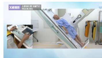
医用画像・診療放射線動画 Medical Imaging