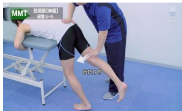
理学療法 physical therapy

メディカルオンライン ビデオは医師や看護師、医療技術者、学生など、あらゆる医療関係者のための新しい医療動画配信サービスです。手術や各種手技など、多彩なラインアップで学生から医療従事者まで幅広い層にご利用いただけます。