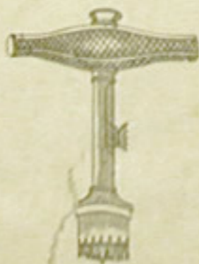
第十三圖帽頭穿骨錐