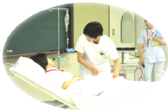
シミュレーション教育の一場面

「組織的役割遂行」では、各グループに分かれ“今困っていること、悩んでいること”について話し合い、KJ法で取組や解決策を導きだし発表しました。