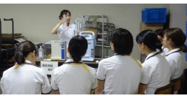
看護の統合と実践Ⅰ「ME機器の理論と操作」の演習の様子