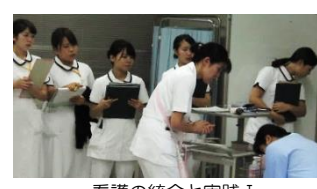
看護の統合と実践Ⅰシミュレーションの様子