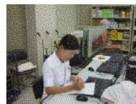
病棟で復帰前の研修をしてきました。

今回は臨床研修を実践された方もおられ、臨床研修後、電子カルテ研修でパソコン操作を体験されました。