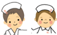
写真左：M 看護師 写真右：T 看護師

一同期とご飯に行ったりして、同じような思いを持っていることがわかり、同期に支えられていることに感謝しています。1人1人自分のペースがあるので、自分のペースで笑顔で一緒に頑張りましょう!!