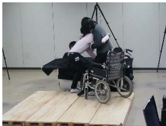
図3 介護士の入浴介助動作の解析の研究