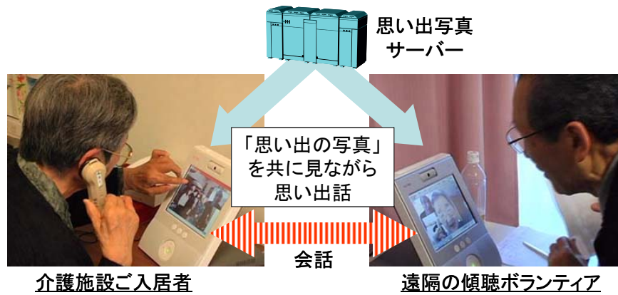
図4 高齢者の対話支援システムの研究